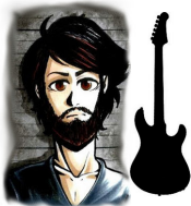
Tobi Guitar 1

Head: Randall RG 1503 Head (150W an 4 Ohm, 100W an 8 Ohm) verschiedene Effekt-Pedale KEIN IN-EAR! Für Tobi wird eine Monitorbox auf der Bühne benötigt.