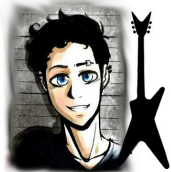
Bene Guitar 2

Head: Engl E535 Preamp + Palmer Macht 402 (2x 200W an 4 Ohm, 2x 100W an 8 Ohm oder 1x 400W an 8 Ohm) Box: Laney (160W an 8 Ohm, Celestion G12T-75 + Vintage 30) Pedalboard mit Funk: Line6 G30 (2,4 GHz) In-Ear: LD Systems MEI 100 G2 (923 - 932 MHz)